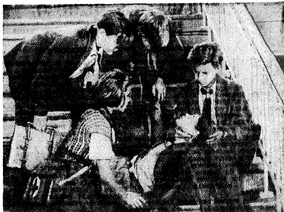
Кадр из фильма «Личное дело». (Союздетфильм. Режиссер А. Разумный, оператор А. Селянин). Сцена драки школьников